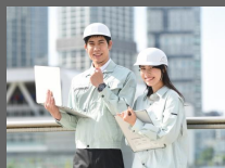
電気設備工事会社 工事工程管理システム