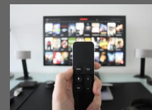
大手動画配信サービス会社システム