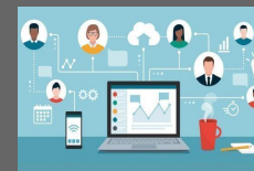
省庁人事管理システム