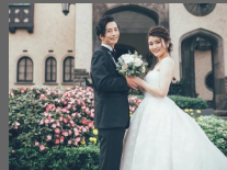
結婚式場管理システム