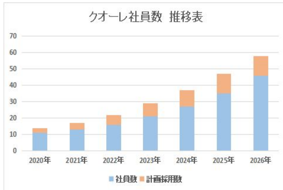
クオーレ社員数 推移表