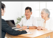
相続財産分割 シミュレーションシステム